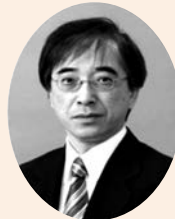
鳥取大学医学部 地域医療学講座 教授