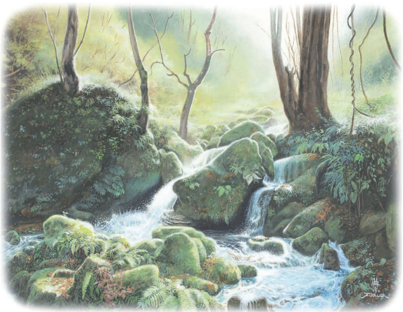
渓谷の朝日（雨滝あたり） アクリル画 10号 （鳥取県美術家協会会員 福田典高氏）