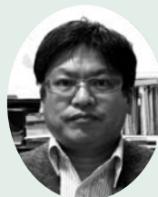
鳥取大学医学部 環境予防医学分野 教授